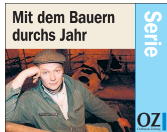
Mit dem Bauern durchs Jahr

Der Maisberater fachsimpelt. Es fallen Ausdrücke wie „Zellwandverdaulichkeit“