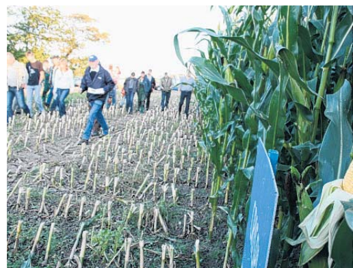
Ein Gang übers Feld.