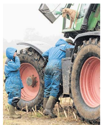
Bei der Reparatur.

Wie dünn das Nervenkosium dennoch ist, wird beim