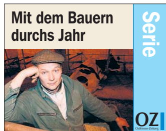
Mit dem Bauern durchs Jahr